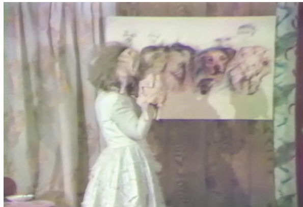
video still Hobby horses in paradise

Nina Sobell discovered that the very presence of technology alters peoples' behavior, due to its capacity to mediate experience, to manipulate space and time, and due also to peoples' belief in its power. She has used these phenomena to sculpt social space. In other words, she has used technology as a prop to give participants permission to overcome various types of boundaries--physical and social--to communicate with one another.